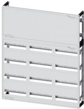
ALPHA 400, Schnellmontagebausatz H=900, B=750 2 Reihenklennen, 4 Reihen REG