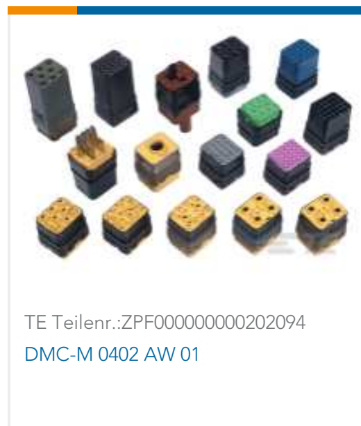
TE Teilnr.:ZPF000000000202094 DMC-M 0402 AW 01