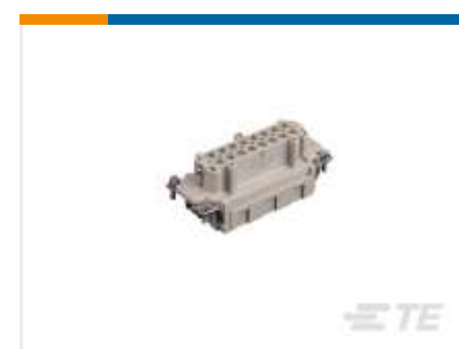
TE Teilnr.: T2040324201-000 HE-016-FC 17-32