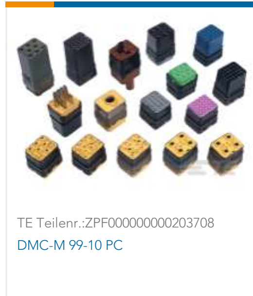
TE Teilnr.:ZPF000000000203708 DMC-M 99-10 PC