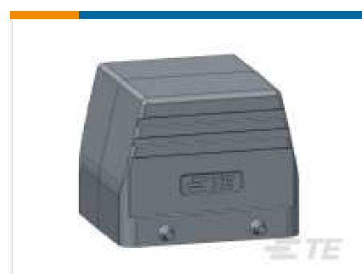
TE Teilnr.: T1210320140-000 H32B-TS-M40