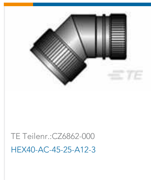
TE Teilnr.:CZ6862-000 HEX40-AC-45-25-A12-3