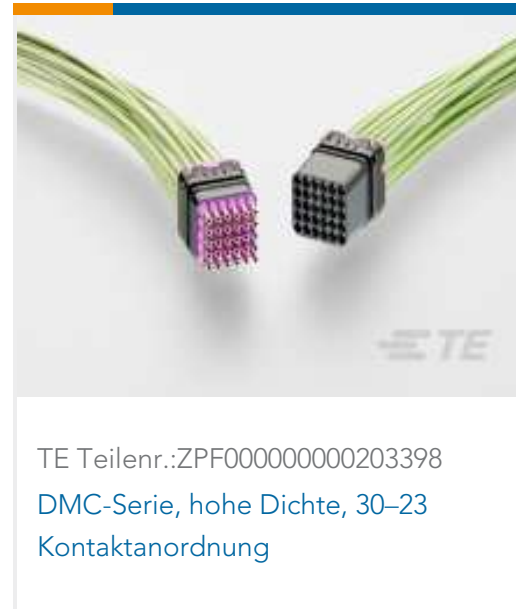
TE Teilnr.:ZPF000000000203398 DMC-Serie, hohe Dichte, 30-23 Kontaktnanordnung