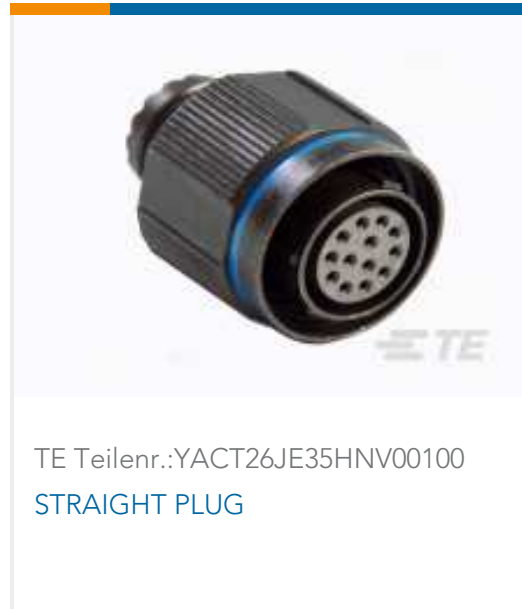
TE Teilnr.:YACT26JE35HNV00100 STRAIGHT PLUG