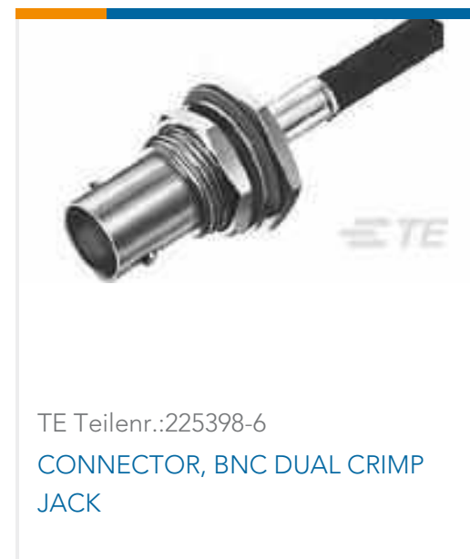
TE Teilnr.:225398-6 CONNECTOR, BNC DUAL CRIMP JACK