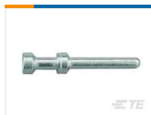
TE Teilnr.: T2030001040-000 CEM-4.0