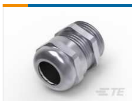
TE Teilnr.: T3609400102-000 DLX-40-M