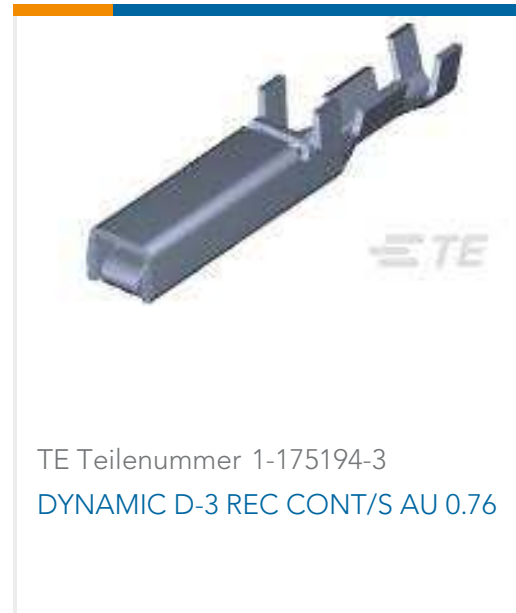
TE Teilenummer 1-175194-3 DYNAMIC D-3 REC CONT/S AU 0.76