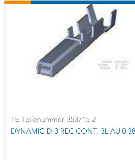
TE Teilenummer 353715-2 DYNAMIC D-3 REC CONT. 3L AU 0.38