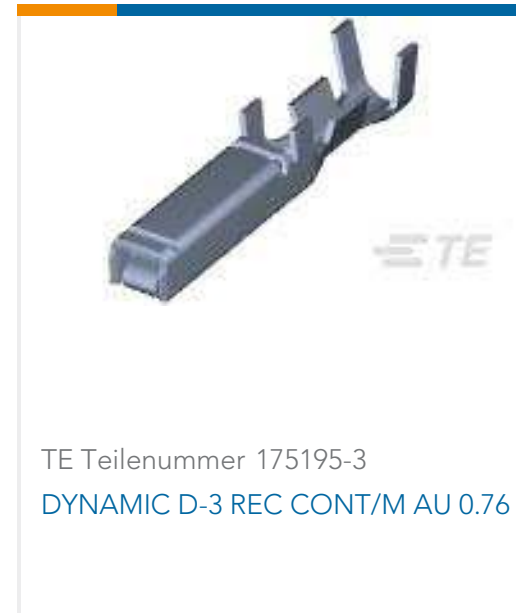
TE Teilenummer 175195-3 DYNAMIC D-3 REC CONT/M AU 0.76