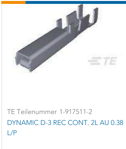
TE Teilenummer 1-917511-2 DYNAMIC D-3 REC CONT. 2L AU 0.38 L/P