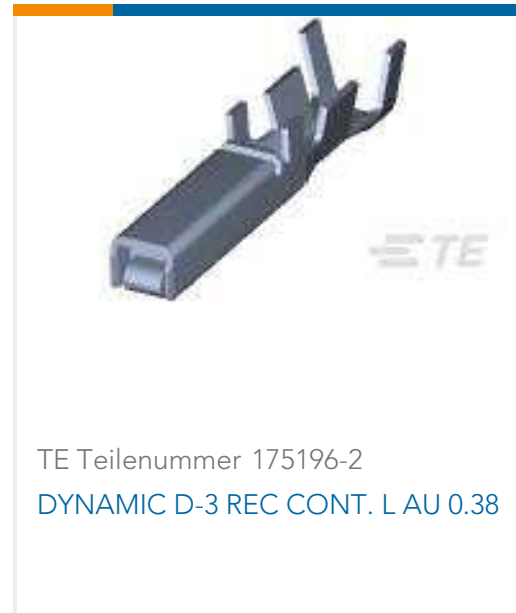
TE Teilenummer 175196-2 DYNAMIC D-3 REC CONT. L AU 0.38