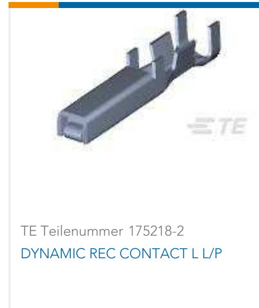
TE Teilenummer 175218-2 DYNAMIC REC CONTACT L L/P