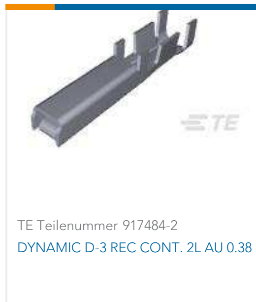
TE Teilenummer 917484-2 DYNAMIC D-3 REC CONT. 2L AU 0.38