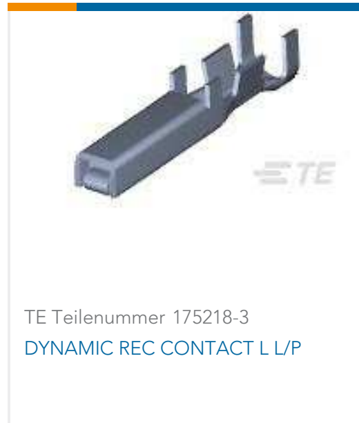
TE Teilenummer 175218-3 DYNAMIC REC CONTACT L L/P