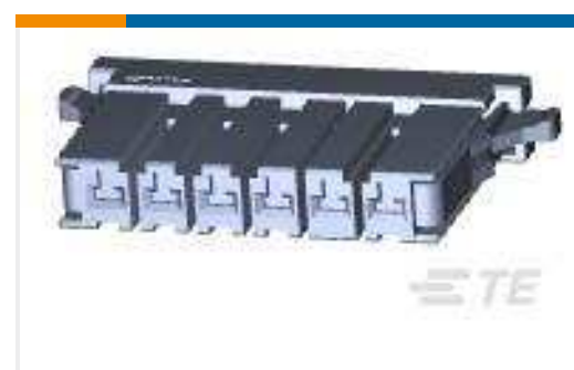
TE Teilenummer1-178128-6 DYNAMIC 3200 REC HSG 6P X