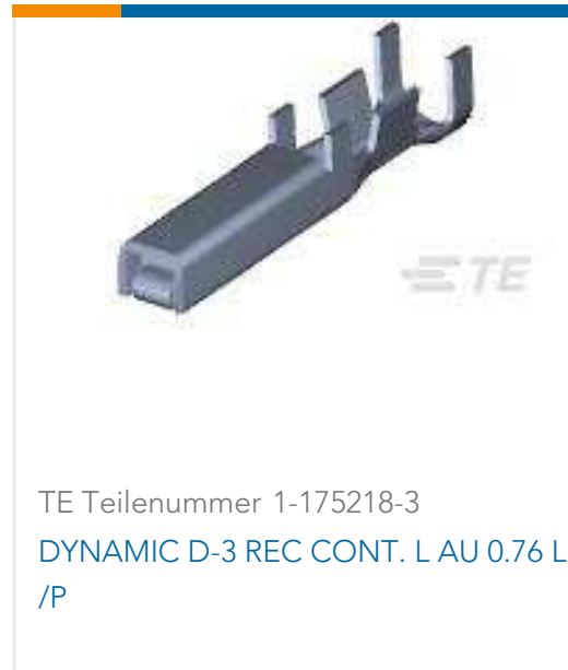
TE Teilenummer 1-175218-3 DYNAMIC D-3 REC CONT. L AU 0.76 L/P