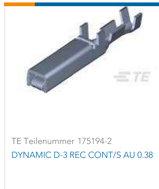
TE Teilenummer 175194-2 DYNAMIC D-3 REC CONT/S AU 0.38