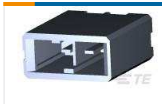
TE Teilenummer1-917337-2 DYNAMIC D-3 VERTI. HDR ASSY 2P