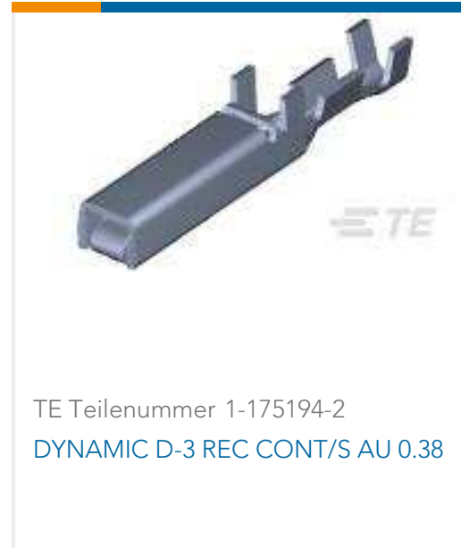
TE Teilenummer 1-175194-2 DYNAMIC D-3 REC CONT/S AU 0.38