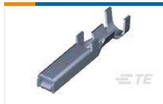
TE Teilenummer175217-2 DYNAMIC REC CONTACT M L/P