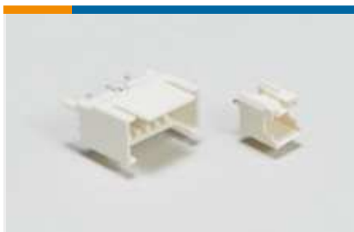
Draht-an-Leiterplatte-Steckkontakte und -sockel(14)