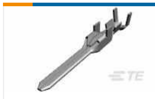
TE Teilenummer175285-2 DYNAMIC D-3 TAB CONT. M AU 0.38