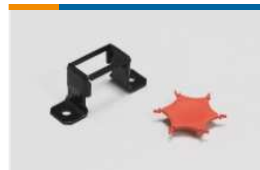
Montage- und Arretierzubehör für Schraubklemmen und Strips(1)