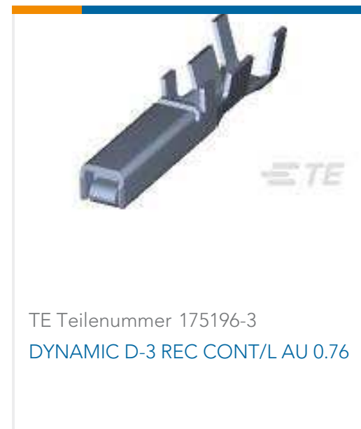
TE Teilenummer 175196-3 DYNAMIC D-3 REC CONT/L AU 0.76