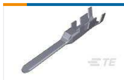
TE Teilenummer353718-2 DYNAMIC D-3 TAB CONT. 3L AU 0.38 L/P