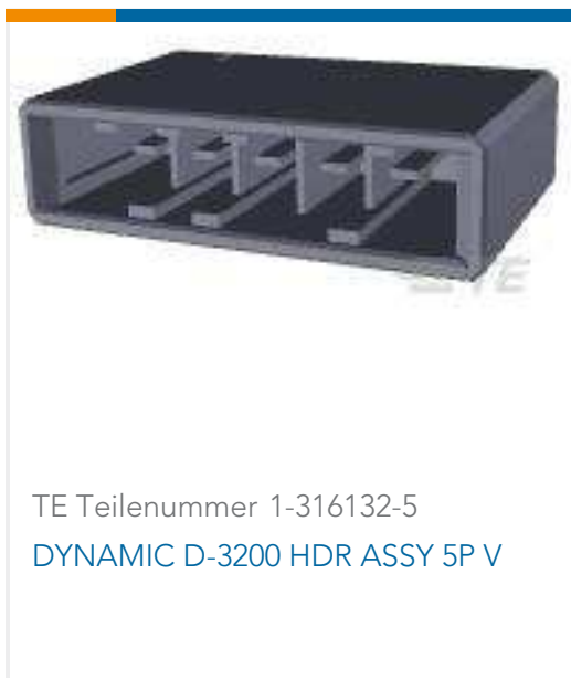
TE Teilenummer 1-316132-5 DYNAMIC D-3200 HDR ASSY 5P V