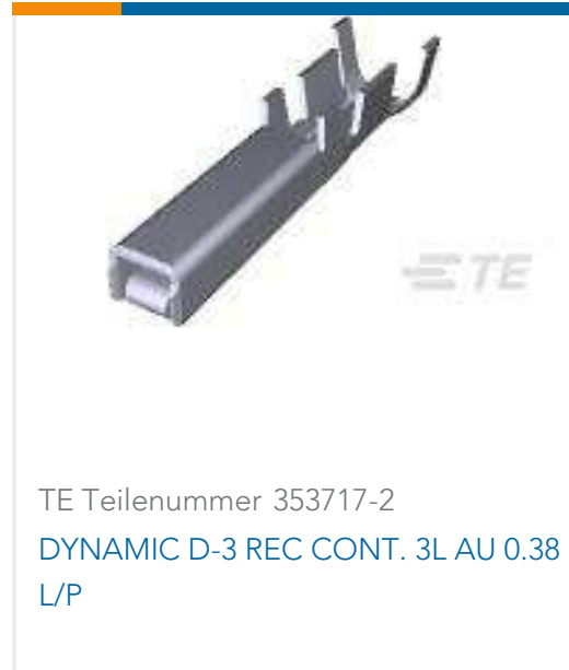
TE Teilenummer 353717-2 DYNAMIC D-3 REC CONT. 3L AU 0.38 L/P