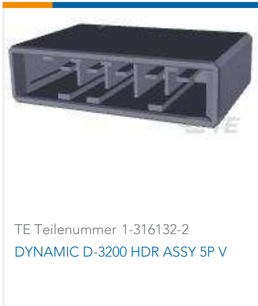
TE Teilenummer 1-316132-2 DYNAMIC D-3200 HDR ASSY 5P V