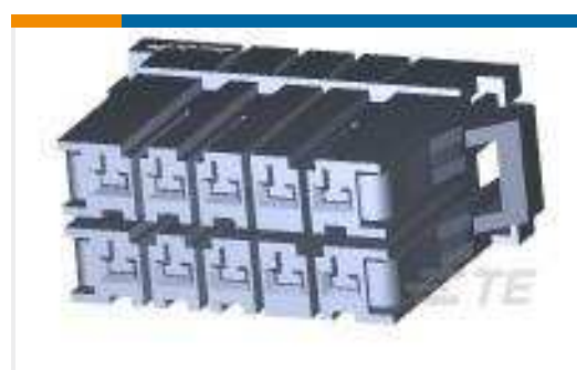
TE Teilenummer1-917659-5 DYNAMIC 3200 D/ROW REC HSG 10P