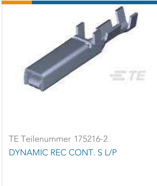
TE Teilenummer 175216-2 DYNAMIC REC CONT. S L/P