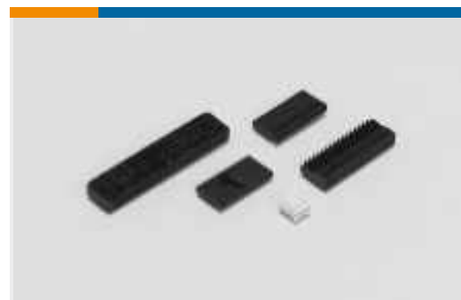
Kabel-an-Leiterplatte-Steckverbindersätze und -gehäuse(2)