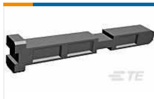
TE Teilenummer175855-1 DYNAMIC KEYING PLUG FOR REC