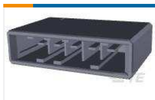
TE Teilenummer1-316132-2 DYNAMIC D-3200 HDR ASSY 5P V