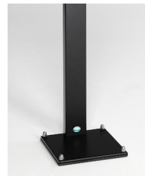
Abb. Artikelnr. 12059