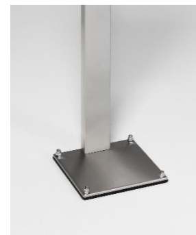
Abb. Artikelnr. 12081