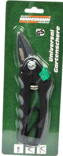
Multifunktions-Gartenschere, auf Blisterkarte