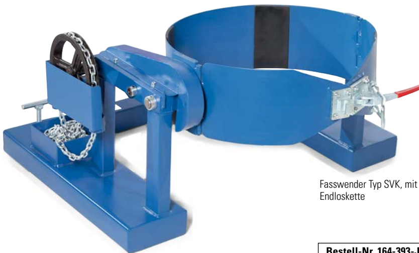
Fasswender Typ SVK, mit Endloskette