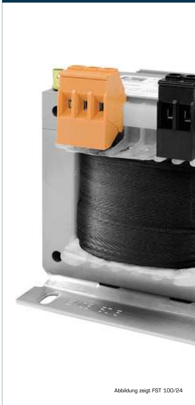
Abbildung zeigt FST 100/24