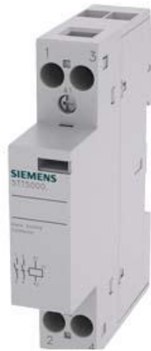
INSTA SCHUETZ MIT 2 SCHLIESSERN KONTAKT FUER AC 230,400V 20A ANSTEUERUNG ACDC24V