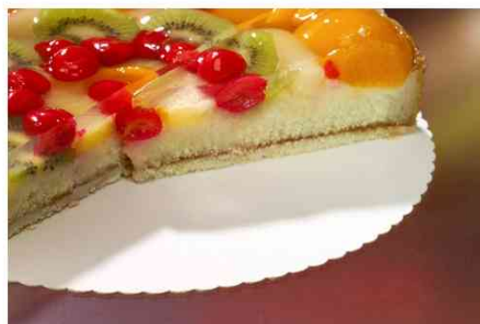
Visuel de référence: exemple d'utilisation