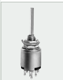
einpolig 9030.0100 6 5 x 60°