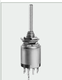
einpolig 9032.0100 8 7 x 45°