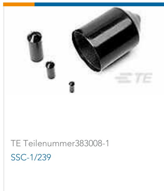
TE Teilenummer383008-1 SSC-1/239