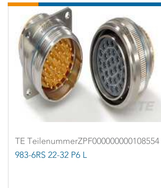
TE TeilenummerZPF000000000108554 983-6RS 22-32 P6 L