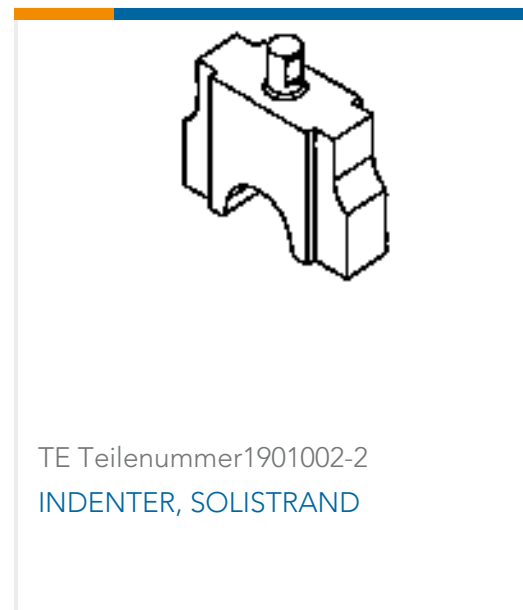
TE Teilenummer1901002-2 INDENTER, SOLISTRAND