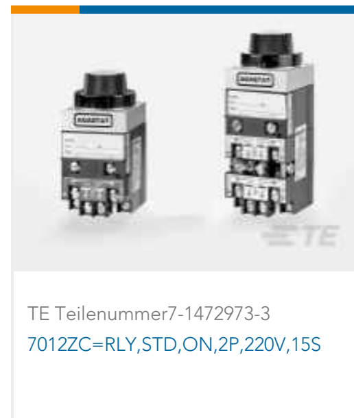
TE Teilenummer7-1472973-3 7012ZC=RLY,STD,ON,2P,220V,15S