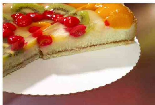
Visuel de référence: exemple d'utilisation