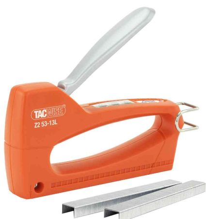
Agrafeuse manuelle Z2 53-13L contenant 300x 53/6 agrafes