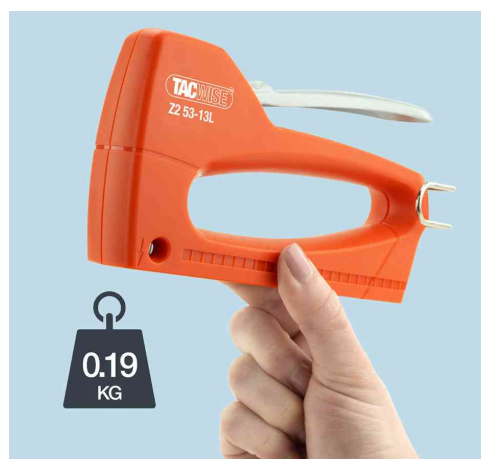
Visuel de référence: montre le poids léger de 190 g