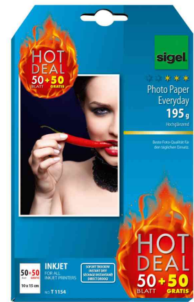
Inkjet-Foto-Papier "Everyday" "HOT DEAL"