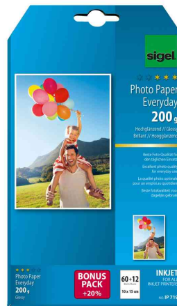
Inkjet-Foto-Papier "Everyday", 72 Blatt