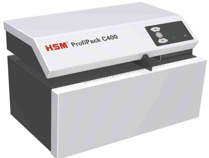
Verpackungspolstermaschine ProfiPack C400