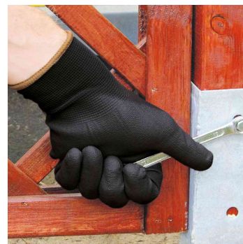
Visuel de référence; présente le produit en utilisation