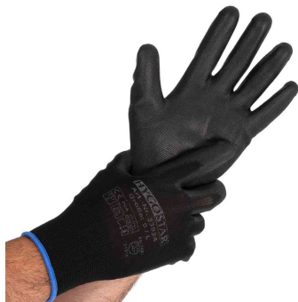
Visuel de référence: Gant de travail "Black ACE"