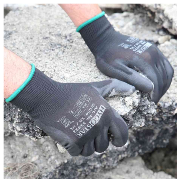
Visuel de référence; présente le produit en utilisation