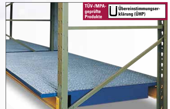
Regalwanne Typ SRW aus Stahl