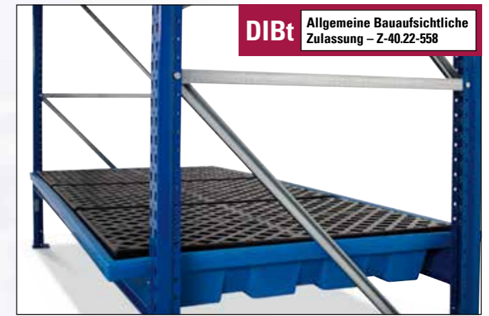
Regalwanne KRW aus Kunststoff