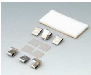
A9176008 Kontaktfedern-Set, 3 x AA Stahl vernickelt

Technische Änderungen vorbehalten. © OKW Gehäusesysteme, Buchen/Deutschland.