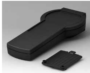
A9076109 DATEC-CONTROL XS, Ausf. I ABS (UL 94 HB) schwarz RAL 9005 200x94x39,5mm IP 65 opt.