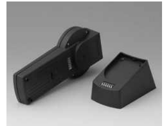
A9076159 SET: DATEC-CONTROL XS, Ausf. I, Socket.. ABS (UL 94 HB) schwarz RAL 9005 200x94mm IP 65 opt.