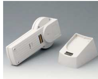
A9076157 SET: DATEC-CONTROL XS, Ausf. I, Socket.. ABS (UL 94 HB) grauweiß RAL 9002 200x94mm IP 65 opt.