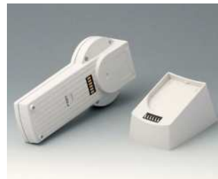
A9076257 SET: DATEC-CONTROL XS, Ausf. II, Socket.. ABS (UL 94 HB) grauweiß RAL 9002 200x94mm IP 65 opt.