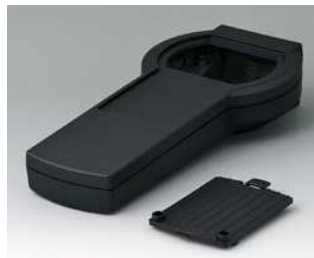
A9076209 DATEC-CONTROL XS, Ausf. II ABS (UL 94 HB) schwarz RAL 9005 200x94x40mm IP 65 opt.