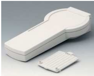
A9076107 DATEC-CONTROL XS, Ausf. I ABS (UL 94 HB) grauweiß RAL 9002 200x94x39,5mm IP 65 opt.