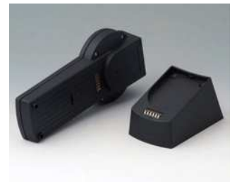
A9076259 SET: DATEC-CONTROL XS, Ausf. II, Socket.. ABS (UL 94 HB) schwarz RAL 9005 200x94mm IP 65 opt.