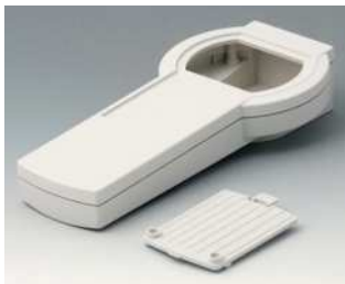
A9076207 DATEC-CONTROL XS, Ausf. II ABS (UL 94 HB) grauweiß RAL 9002 200x94x39,5mm IP 65 opt.