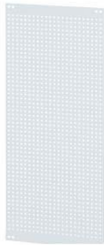
SIVACON SICUBE MONTAGEBL. INNEN HXB 200X1200