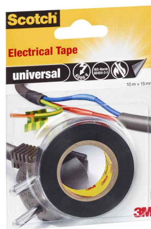
Ruban isolant universel, noir