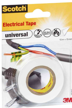
Ruban isolant universel, blanc