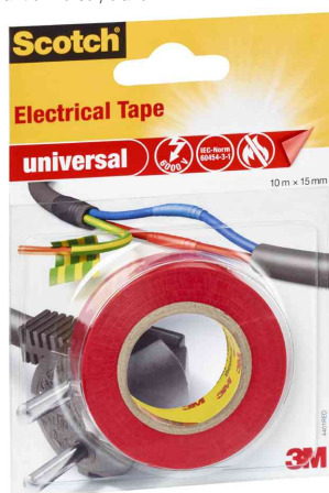
Ruban isolant universel, rouge