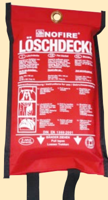
Löschdecke NoFire, Polybag

Lieferung in einer speziellen Kunststofftasche, mit Aufhängeöse. Außenmaß B x T x H (mm): 190 x 45 x 310