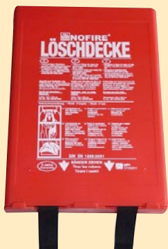
Löschdecke NoFire, Box

Lieferung in einer Kunststoff-Wandbox, mit Aufhängeöse. Außenmaß B x T x H (mm): 175 x 45 x 250