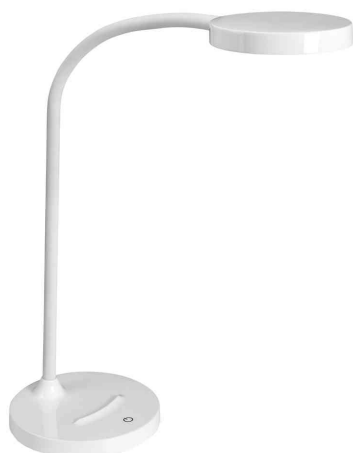
Lampe de bureau LED FLEX, blanc