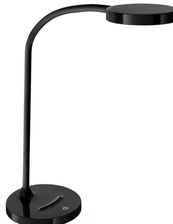
Lampe de bureau LED FLEX, noir