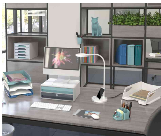
Visuel de référence: montre le produit en utilisation