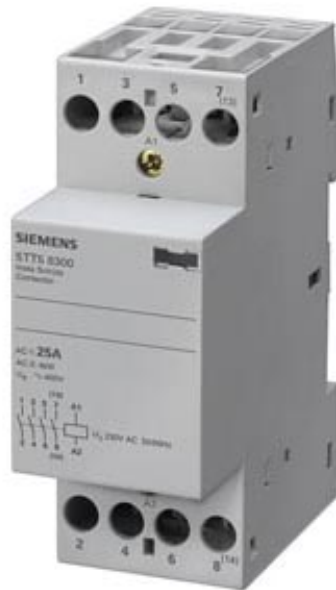
INSTA SCHUETZ MIT 2SCHLIESSERN UND 2 OEFFNERN KONTAKT FUER AC 230,400V 25A ANSTEUERUNG AC24V