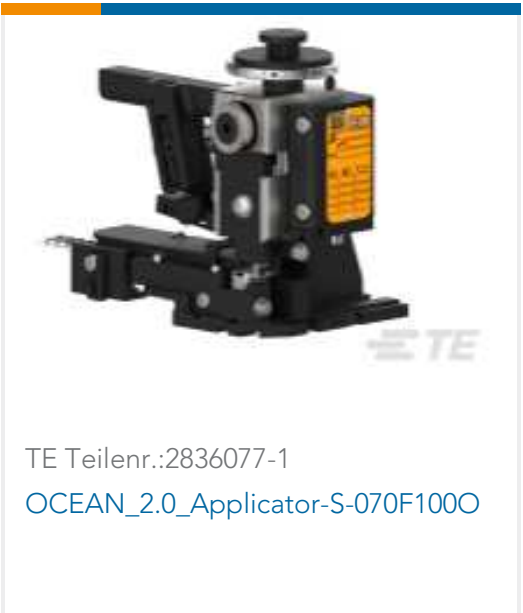
TE Teilnr.:2836077-1 OCEAN_2.0_Applicator-S-070F1000