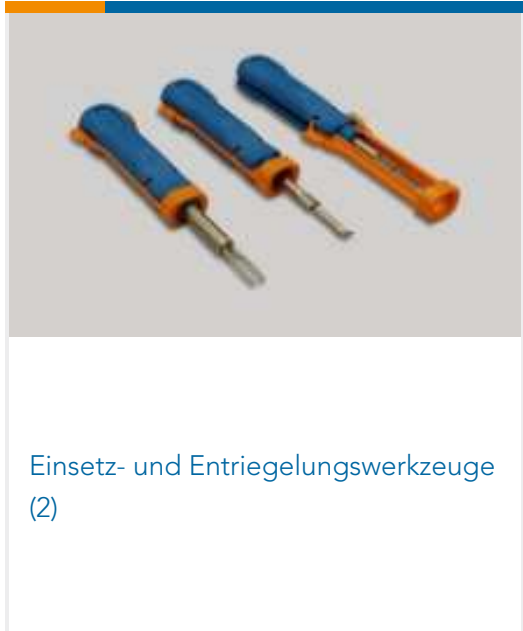
Einsetz- und Entriegelungswerkzeuge (2)