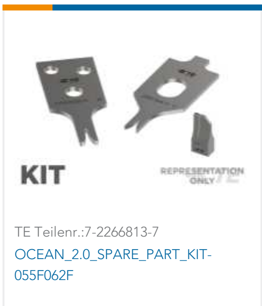
TE Teilnr.:7-2266813-7 OCEAN_2.0_SPARE_PART_KIT-055F062F