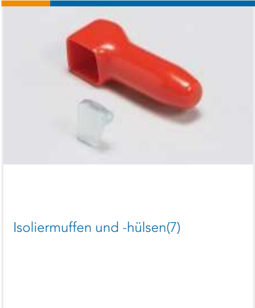
Isoliermuffen und -hülsen(7)