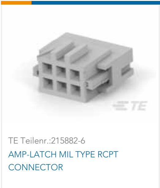
TE Teilnr.:215882-6 AMP-LATCH MIL TYPE RCPT CONNECTOR