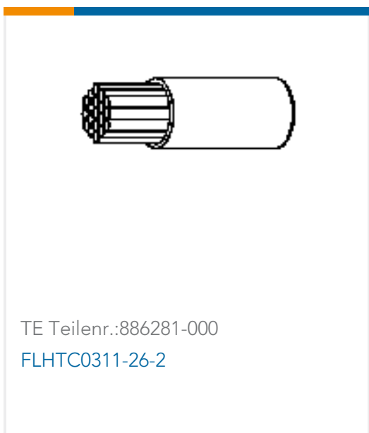
TE Teilnr.:886281-000 FLHTC0311-26-2