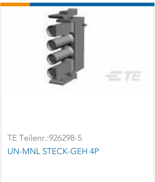
TE Teilnr.:926298-5 UN-MNL STECK-GEH 4P