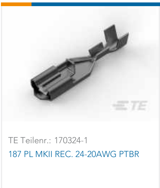
TE Teilnr.: 170324-1 187 PL MKII REC. 24-20AWG PTBR