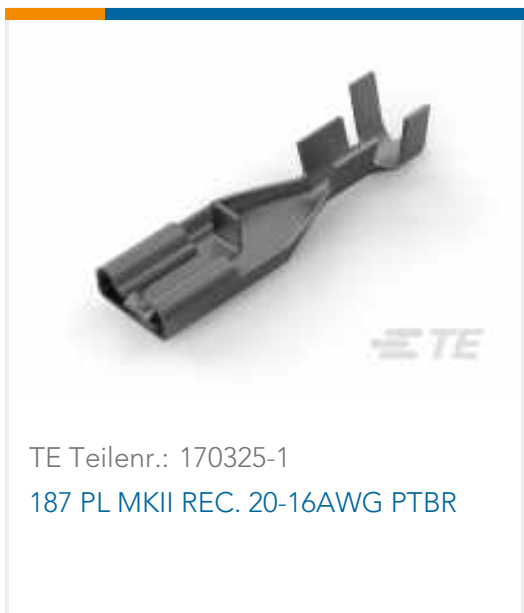
TE Teilnr.: 170325-1 187 PL MKII REC. 20-16AWG PTBR