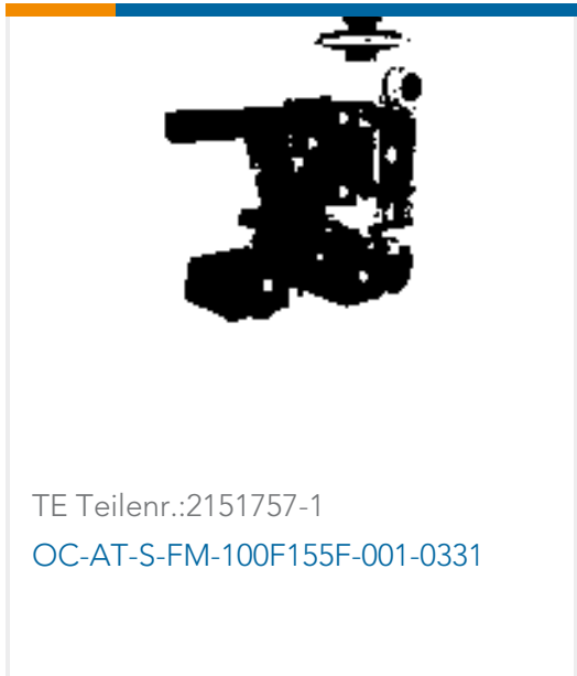
TE Teilnr.:2151757-1 OC-AT-S-FM-100F155F-001-0331