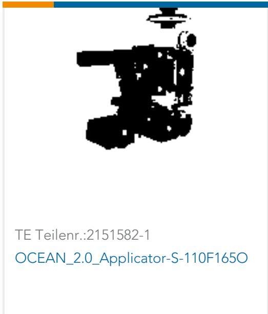
TE Teilnr.:2151582-1 OCEAN_2.0_Applicator-S-110F1650