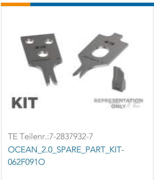
TE Teilnr.:7-2837932-7 OCEAN_2.0_SPARE_PART_KIT-062F0910