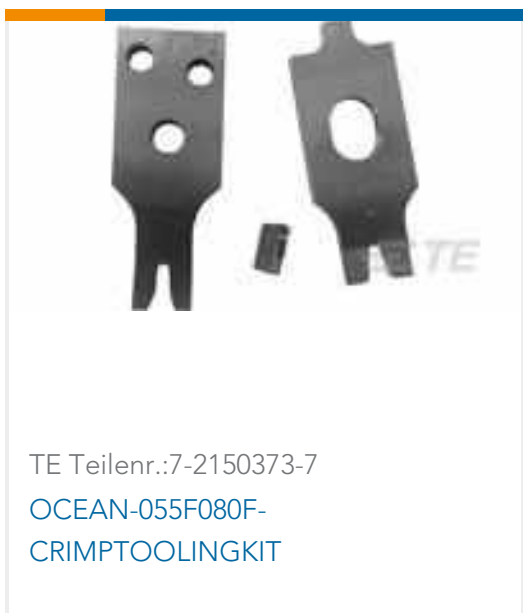
TE Teilnr.:7-2150373-7 OCEAN-055F080F-CRIMPTOOLINGKIT