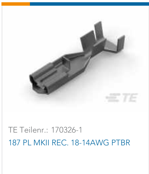
TE Teilnr.: 170326-1 187 PL MKII REC. 18-14AWG PTBR