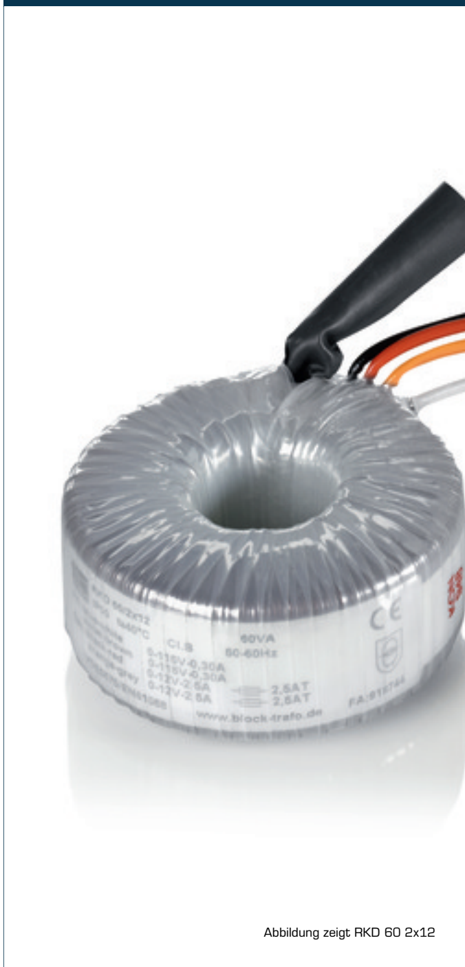
Abbildung zeigt RKD 60 2x12