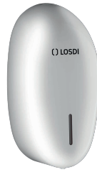
REF: CJ-1005 Acabado BLANCO