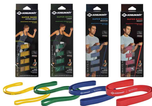
Visuel de référence : Bande de résistance Super Band