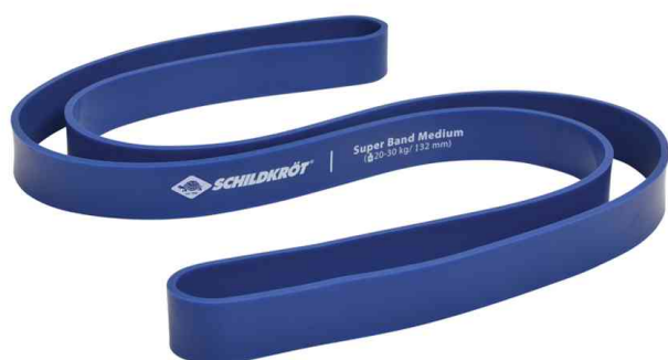
Visuel de référence : Bande de résistance Super Band

- pour s'entraîner à la stabilité, à la musculation et aux tractions