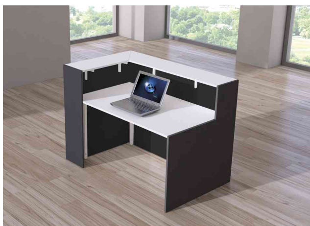
Visuel de référence : présente la vue arrière du comptoir en anthracite