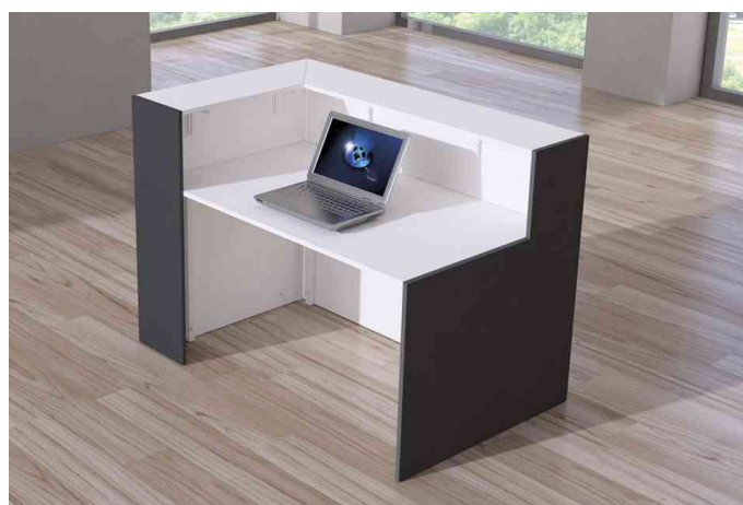
Visuel de référence : présente la vue arrière du comptoir en blanc