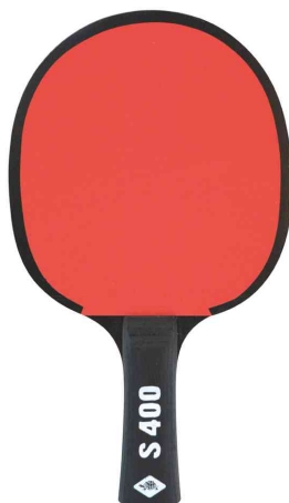
Raquette de tennis de table Protection Line "S400"