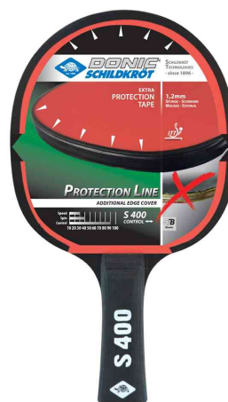
Raquette de tennis de table Protection Line "S400"