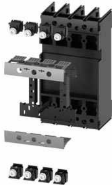
Steckereinheit Komplettbausatz Zubehör für: Leistungsschalter, 4-polig 3VA11