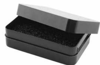
9-316-VE5 57 x 36 x 17 mm

Aufbewahrungsbox für Mikroprozessoren, Platinen, Chips usw. leitfähig 10 2 bis 10 5 Ohm, mit leitfähiger Schaumeinlage Innenmaße 57 x 36 x 17 mm, Gewicht: 15 g