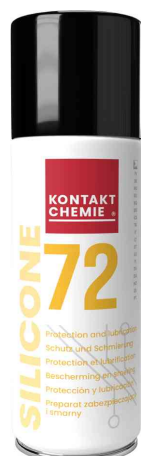
Huile aux silicones "SILICONE 72"