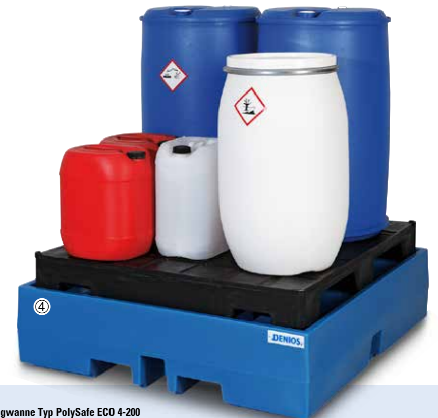
Auffangwanne Typ PolySafe ECO 4-200 komplett mit PE-Palette als Stellfläche, Bestell-Nr. 160-730-J9