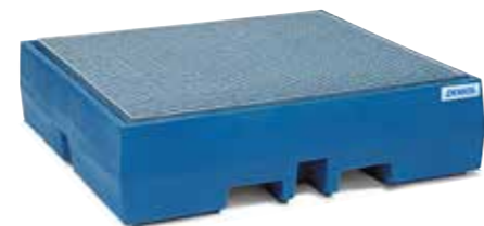
Auffangwanne Typ PolySafe ECO 4-200 für 4 Fässer à 200 Liter, mit verzinktem Gitterrost als Stellfläche, Bestell-Nr. 162-290-J9