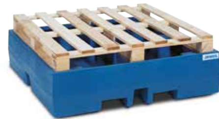
Auffangwanne PolySafe ECO zum passgenauen Lagern von Chemiepaletten