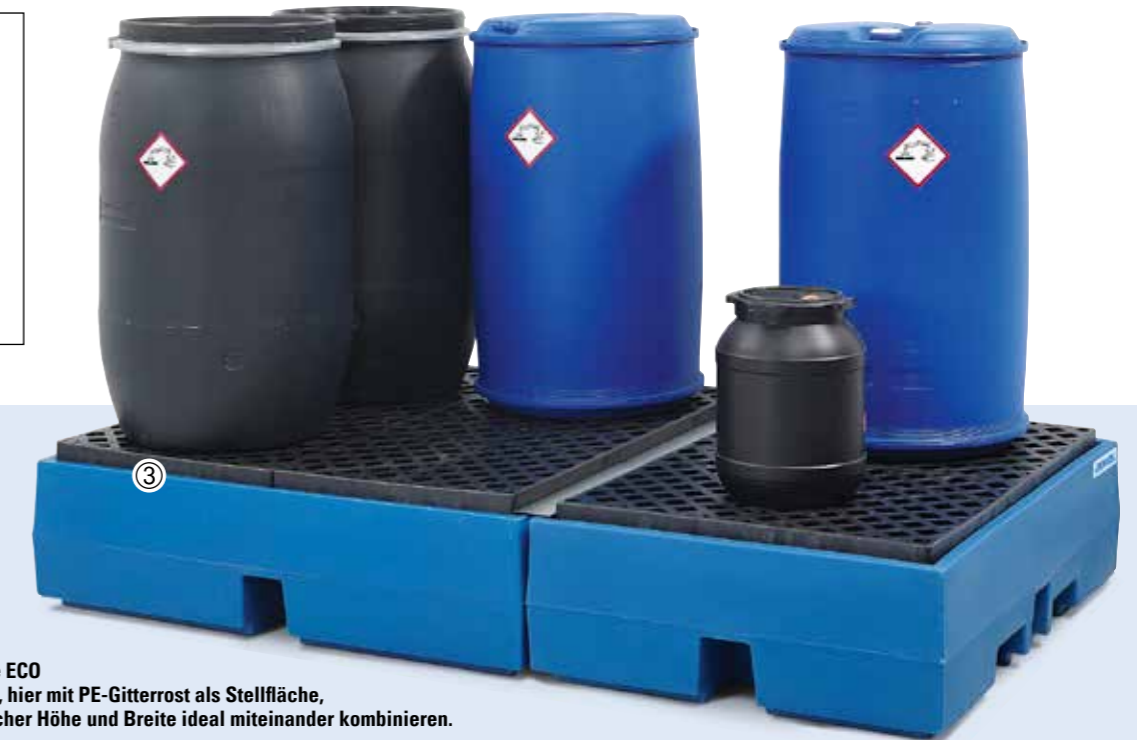
Auffangwannen Typ PolySafe ECO für 2 bzw. 4 Fässer à 200 Liter, hier mit PE-Gitterrost als Stellfläche, lassen sich aufgrund identischer Höhe und Breite ideal miteinander kombinieren.