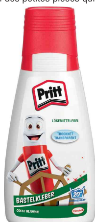
Colle de bricolage, 100 g