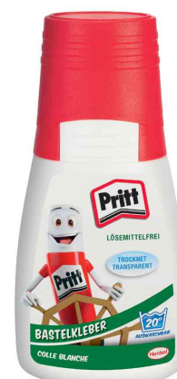
Colle de bricolage, 50 g