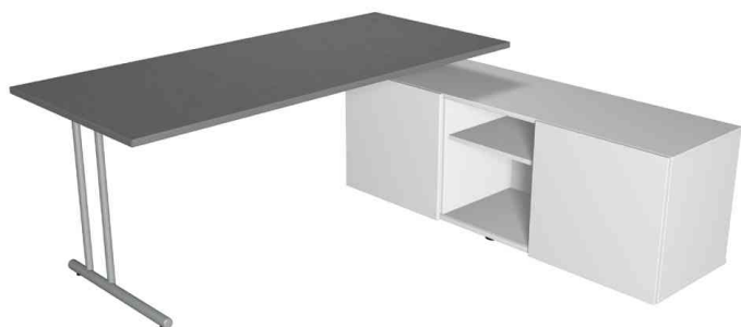
Poste de travail complet "Start Up", graphite