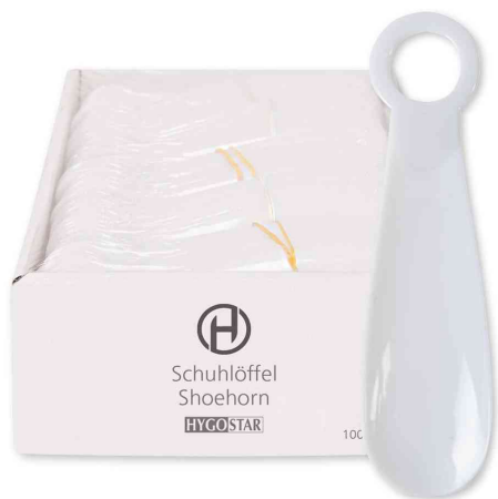
Chausse-pied, emballage individuel