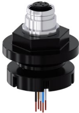
Adapter M12-Buchse, 5-polig, zur M20/M25 Kabeleinführung, für Kunststoff-/Metallgehäuse