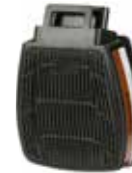
D8095 A2 P3 R