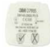
D7935 P3 R