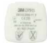
D7915 P1 R