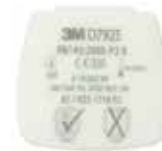
D7925 P2 R