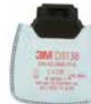
D3138 P3 R/ Partikelfilter mit Aktivkohle