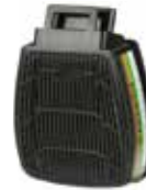
D8094 ABEK P3 R