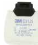
D3125 P2 R