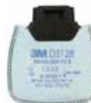
D3128 P2 R/ Partikelfilter mit Aktivkohle