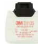
D3135 P3 R