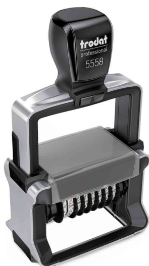
Numéroteurs Professional 4.0 5558/PL

Info: nous livrons tous les tampons configurables à domicile à partir d'une commande d'une pièce! S'il vous plaît, tenez compte du fait que les tampons configurables sont toujours traités dans une commande séparée!