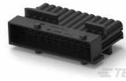
TE Teilnr.:964739-1 FLA-STE-GEH2,8 24P