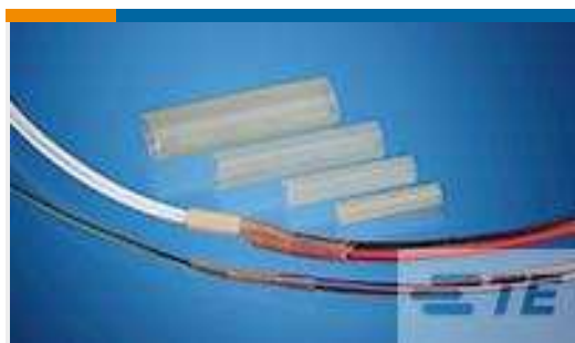
TE Teilnr.:7121976007 RBK-VWS-125-NR3-X-50MM