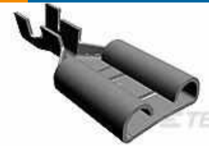
TE Teilnr.:280223-2 FASTON 375 ASY REC 4-6MM2 0.5X27. 0 TPBR