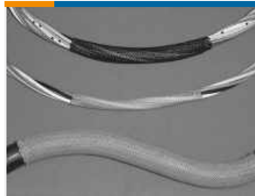
TE Teilnr.:E113174001 VERSAFLEX-FR-1/4-09-SP