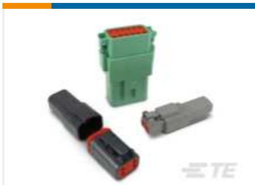
TE Teilnr.:DT04-12PA-CE01 DEUTSCH DT GEHÄUSE