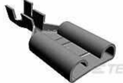
TE Teilnr.:150530-1 FASTON 375 AM REC 2-6MM2 0.2X1. 062 BR