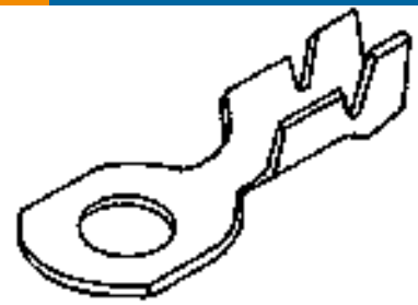
TE Teilnr.:60123-2 RING 160 CRIMP TAB 26-20 AWG TPBR