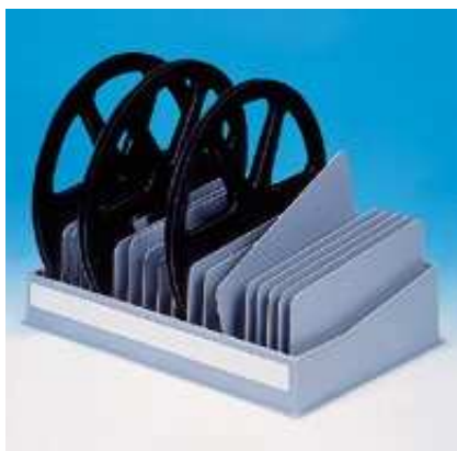
Art.-Nr. V 11-14 mit 10 variablen Zwischenstegen und durchgehender Kennzeichnungsschiene (für Spulen bis Ø 380) Grundmaße: 455 x 360 Farbe