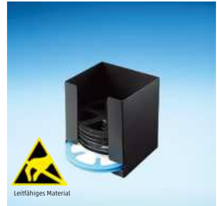
Art.-Nr. V 11-8-6-10 (leitfähig) Spulenständer zur flachen Lagerung von SMD-Spulen bis Ø 180 (First in / First out) Außenmaße: 186 x 173 x 210 Innenmaße: 182 x 169 x 190