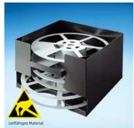
Art.-Nr. V 11-15-6-10 (leitfähig) Spulenständer zur flachen Lagerung von SMD-Spulen bis Ø 380 (First in / First out) Außenmaße: 380 x 370 x 250 Innenmaße: 375 x 365 x 230