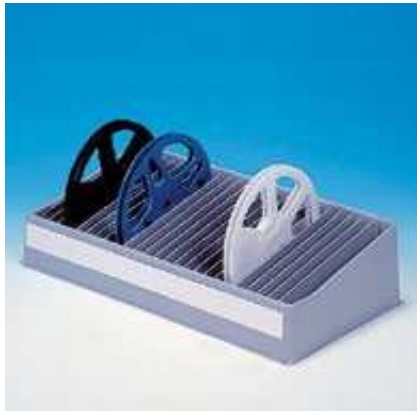
Art.-Nr. V 11-4 (nicht EGB) mit 25 variablen Zwischenstegen und durchgehender Kennzeichnungsschiene (für Spulen Ø 250) Grundmaße: 450 x 240 Farbe