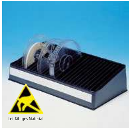
Art.-Nr. V 11-4-6-10 (EGB) mit 25 variablen Zwischenstegen und durchgehender Kennzeichnungsschiene (für Spulen bis Ø 250) Grundmaße: 450 x 240 Farbe