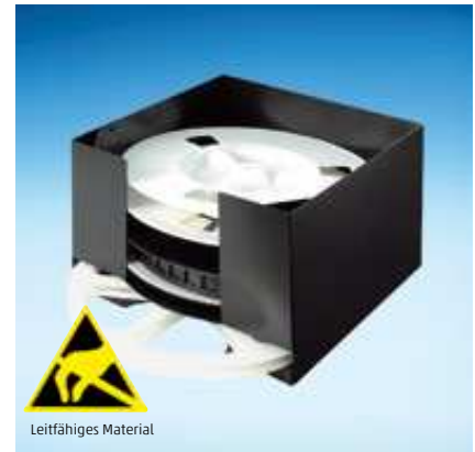
Art.-Nr. V 11-9-6-10 (leitfähig) Spulenständer zur flachen Lagerung von SMD-Spulen bis Ø 330 (First in / First out) Außenmaße: 339 x 319 x 210 Innenmaße: 335 x 315 x 190