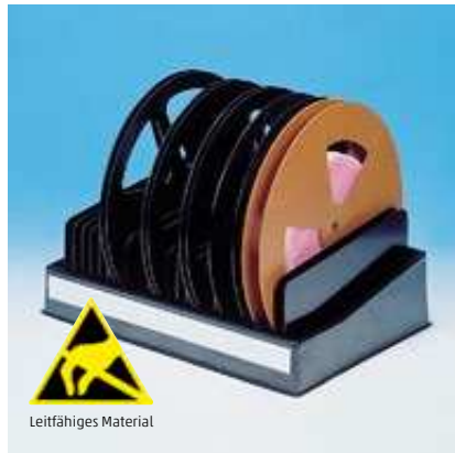
Art.-Nr. V 11-7-6-10 (EGB) mit 25 variablen Zwischenstegen und durchgehender Kennzeichnungsschiene (für Spulen bis Ø 330) Grundmaße: 455 x 315 Farbe