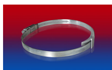
CLAMP 210 BRIDGE CLAMP