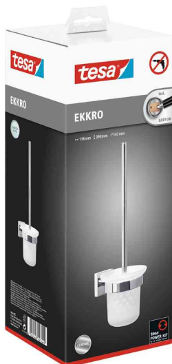
WC-Garnitur EKKRO, Verpackung

Weitere Artikel der Serie EKKRO finden Sie über die Stichwortsuche im WebShop!