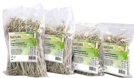
Fingerfood-Spieße LOOP NATURE Star, im Polybeutel