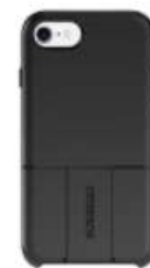
Nero 77-54090 660543403838

Elimina materiali per il confezionamento al dettaglio non necessari