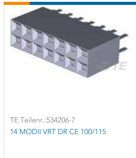
TE Teilnr.:534206-7 14 MODII VRT DR CE 100/115