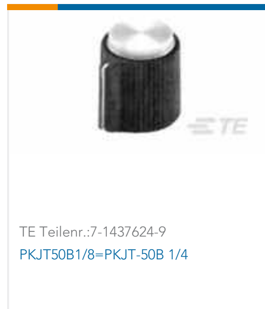
TE Teilnr.:7-1437624-9 PKJT50B1/8=PKJT-50B 1/4