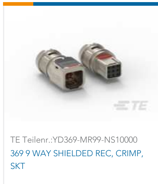
TE Teilnr.:YD369-MR99-NS10000 369 9 WAY SHIELDED REC, CRIMP, SKT