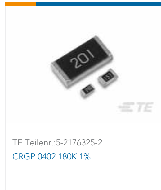
TE Teilnr.:5-2176325-2 CRGP 0402 180K 1%