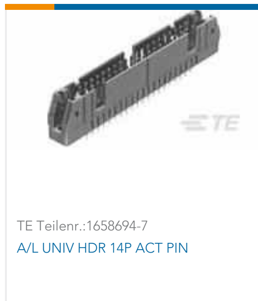
TE Teilnr.:1658694-7 A/L UNIV HDR 14P ACT PIN