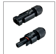
Standard4 connectors / Standard4 Verbinder