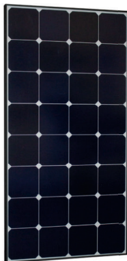
Sun Peak SPR 120 Sun Peak SPR 120_46