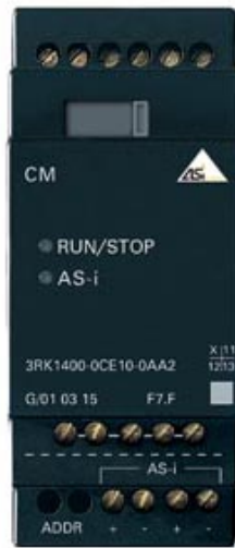
AS-INTERFACE FUNKTIONSMODUL LOGO! STANDARDSLAVE IP20 4DI/4DO