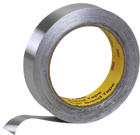
ruban adhésif en aluminium souple 1436F