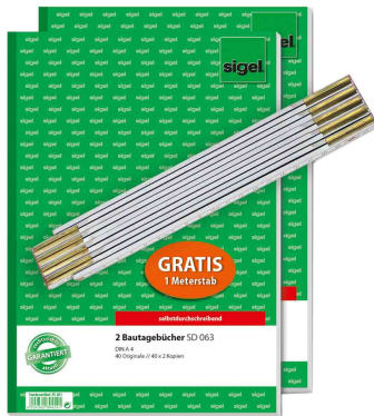
Formularbuch "Bautagebuch" + GRATIS Zollstock